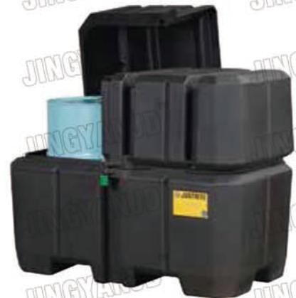
28683 的两个桶盖可以分别打开，方便圆桶的取用。