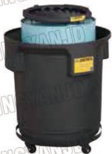
28270 钢轮车上的 28685 及 28680 漏斗

通过 EPA, SPCC 认证，符合 NFPA 1 (2009) 及 IFC 防火条例。